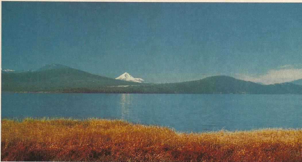
Der Obere Klamath See ist der größte Frischwasser-See im Nordwesten der USA (Süd-Oregon)

peptide her, die die Stimmung beeinflussen. Depression ist nach neuesten Erkenntnissen auch mit Störungen der Neurotransmittersysteme im Gehirn verbunden. Für positives Denken und das Erkennen und Wählen von Möglichkeiten ist erhöhte Energie im Gehirn notwendig.